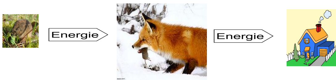
Foto Fuchs: https://upload.wikimedia.org/wikipedia/commons/8/85/Fuchs_Profil.jpg ; Creative Commons Attribution-Share Alike 3.0 Unported ; entnommen: 22.02.2017

Haus mit Umgebung: http://wikiaprende2011.wikispaces.com/unit+5.+my+house ; Creative Commons Attribution Share-Alike 3.0 License; entnommen: 21.02.2017